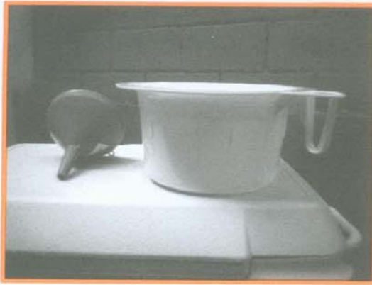
Bacinilla y embudo