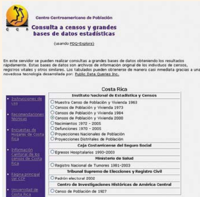
Portal de entrada al servidor en que el usuario escoge la base de datos que desea tabular.

cuidados del adulto mayor, entre otros-. “Hay cosas fascinantes”, asegura Rosero. “Se debe restar la visión apocalíptica que algunos han querido darle al tema. Si el país no se queda de brazos cruzados, no tiene por qué ser así. Incluso hay factores positivos interesantes”.