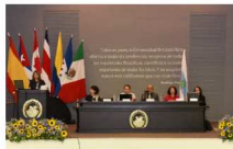
Académicos analizaron pertinencia de acreditación y evaluación docente

Para que el amor triunfe El pasado 26 de junio, la Corte Suprema de Justicia de Estados Unidos estableció una garantía constitucional que permite el matrimonio