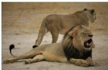
Un dentista estadounidense provoca escándalo por cazar y matar al león Cecil

Golpeando indigentes Las tomas de policías golpeando indigentes ya no es algo que nos llegue del exterior. El otro día no pude evitar la completa indignación