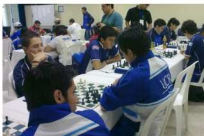
Pase en corto