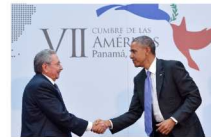
EE.UU. y Cuba restablecen lazos diplomáticos, con izado de bandera cubana