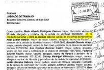
Abogado laboralista del BNCR lidera demanda millonaria contra banco

Golpeando indigentes Las tomas de policías golpeando indigentes ya no es algo que nos llegue del exterior. El otro día no pude evitar la completa indignación