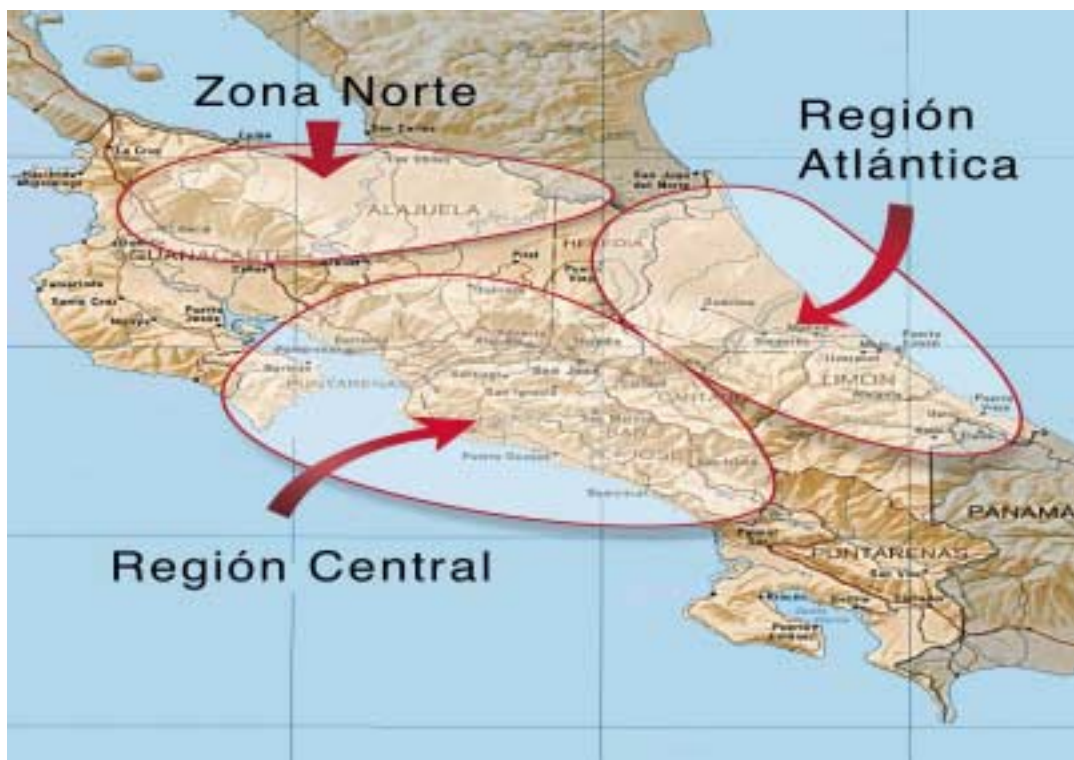
MAPA N# 1 DISTRIBUCION DE LA POBLACION MIGRANTE EN COSTA RICA

La población migrante presenta un proceso de distribución y asentamiento desigual y diferenciado entre las distintas regiones del país. Datos recientes permiten confirmar las tendencias de ubicación geográfica del principal grupo migrante en el país (población migrante nicaragüense) en las que sigue un patrón claramente definido, pues prácticamente se concentra en tres regiones del país: Región Central, Región Atlántica y Zona Norte.