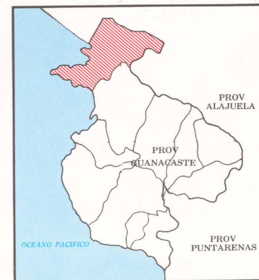
DIAGRAMA DE LOCALIZACION

PREPARADO POR EL INSTITUTO DE FOMENTO Y ASESORIA MUNICIPAL EN COLABORACION CON EL INSTITUTO GEOGRAFICO NACIONAL DE COSTA RICA.