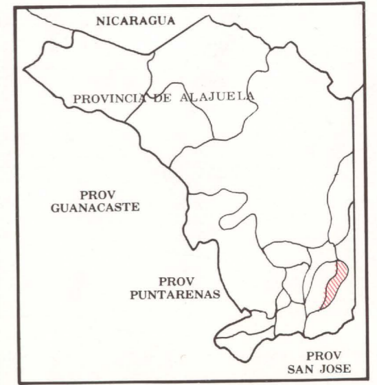
DIAGRAMA DE LOCALIZACION

PREPARADO POR EL INSTITUTO DE FOMENTO Y ASESORIA MUNICIPAL EN COLABORACION CON EL INSTITUTO GEOGRAFICO NACIONAL DE COSTA RICA.